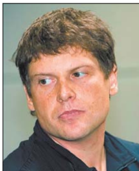
Jan Ullrich taucht plötzlich aus der Isolation auf.